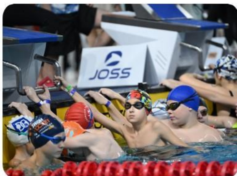
Логотип на стартовых тумбах