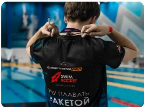
Логотип на футболке тренеров и волонтеров