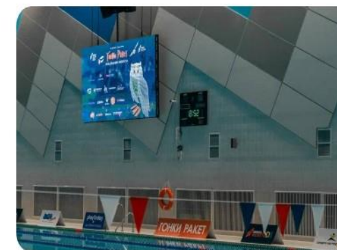
Логотип на бортике бассейна

*Предложенные варианты интеграций наших партнеров на мероприятии не являются окончательными, список открыт для дополнений и может быть расширен.