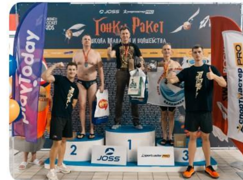
Логотип на тумбах для награждения