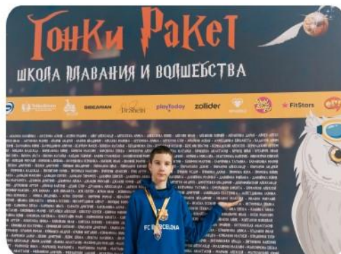
Логотип на пресс – воле с фамилиями участников