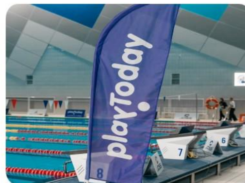
Логотип на флагах