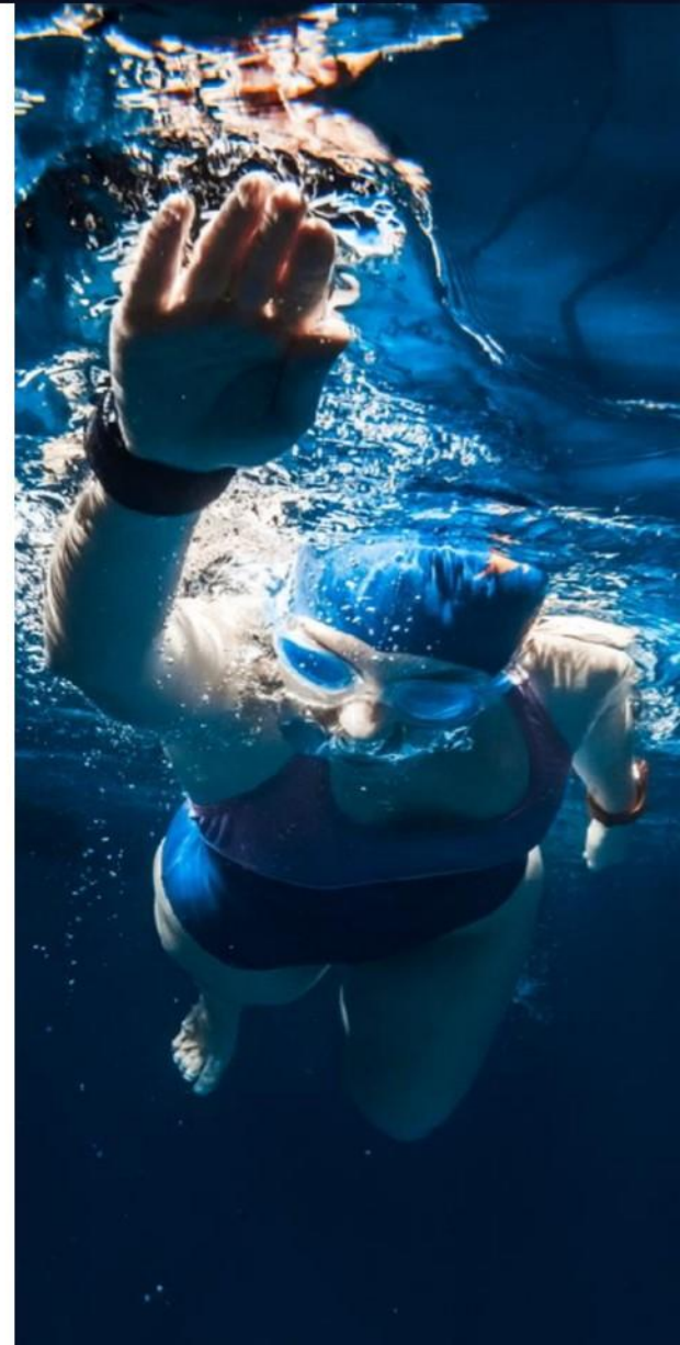
ФОТО И ВИДЕО КОНТЕНТ ДЛЯ УЧАСТНИКОВ СОРЕВНОВАНИЙ