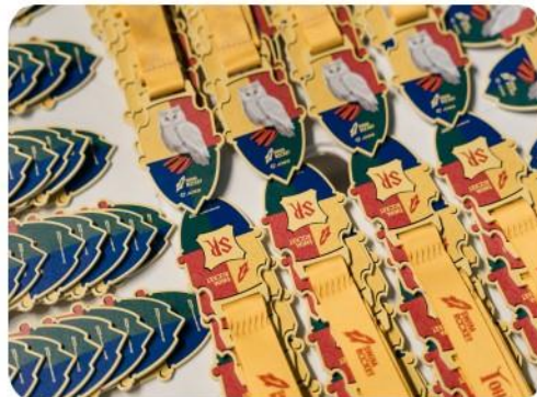
Логотип на лентах и медалях призеров и победителей